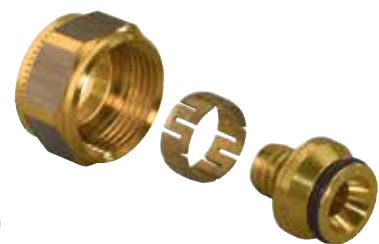
Uponor Vario klemringschroefkoppeling