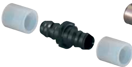
Uponor Quick & Easy koppeling

De natuur vormt onze inspiratie bij het ontwerp van nieuwe producten. Met een minimale hoeveelheid materiaal en energie schept zij perfecte creaties die de hoogste belastingen kunnen weerstaan.