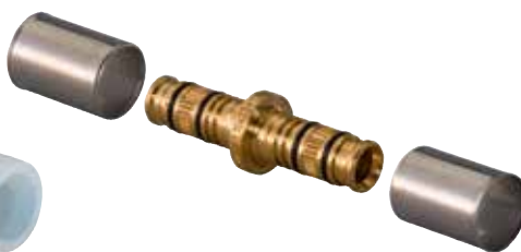
Uponor Rapex perskoppeling